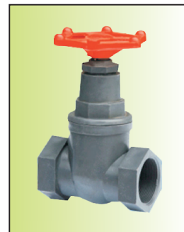
J11P-32[ \bar{P} ]