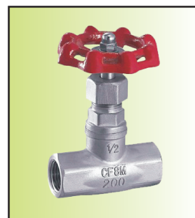
MJ11W-15R (美标) (公称压力为200PSI)