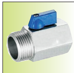
WXQ10P-10BS/[S] 一端内螺纹一端外螺纹