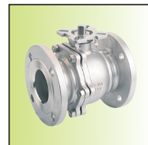
防火型内部防火槽 FH/FJPQ42P-50BFIIIb