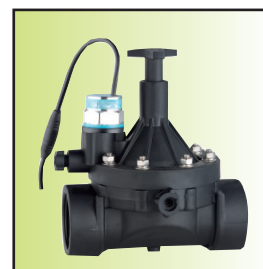
Z199-40 \bar{A} Ib16-mC (DN32~50, IP67) (防雨淋带手动磁保持)