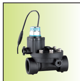
Z199-15 \bar{A} Ib16-mC (DN15~25, IP67) (防雨淋带手动磁保持)