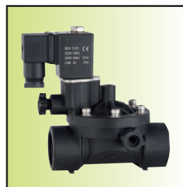
Z199-15 \bar{A} Ib16-C (DN15~25) (带手动磁保持)