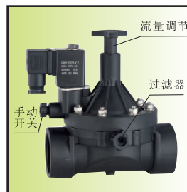
Z199-32 \bar{A} Ib16-C (DN32~50) (带手动磁保持)