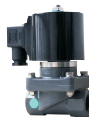
Z 3 CF-15UIa02-E

在线销售QQ: 2880686076 2880686079 2880686085 2880686090 2880686098