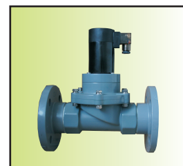
Z 3 CF-50UFIIa24-VD