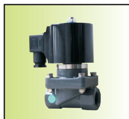
Z 3 CF-15UIa02-E