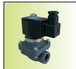
Z 3 CF-15UIa02-EY