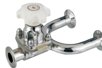
SGM3G-20LK-10-ws-U 3 【U型三通】

在线销售QQ: 2880686076 2880686079 2880686085 2880686090 2880686098