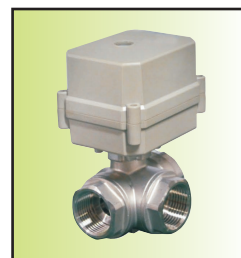
C54032*2-20B II g24