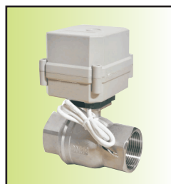
C540*2-32B II g24