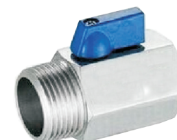
WXQ10P-10BS/[S] 一端内螺纹一端外螺纹